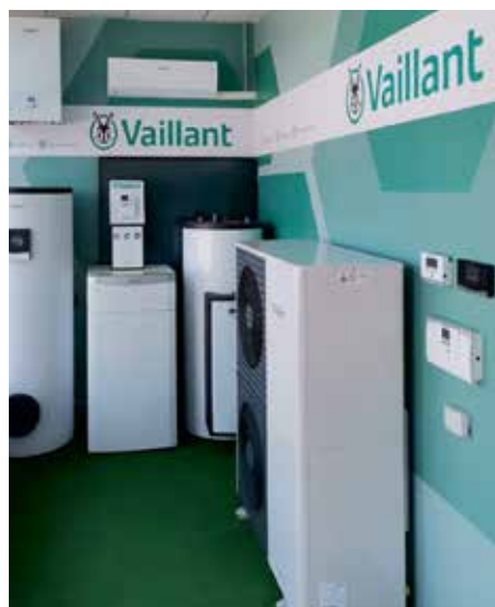
Novouređeni izložbeni prostor