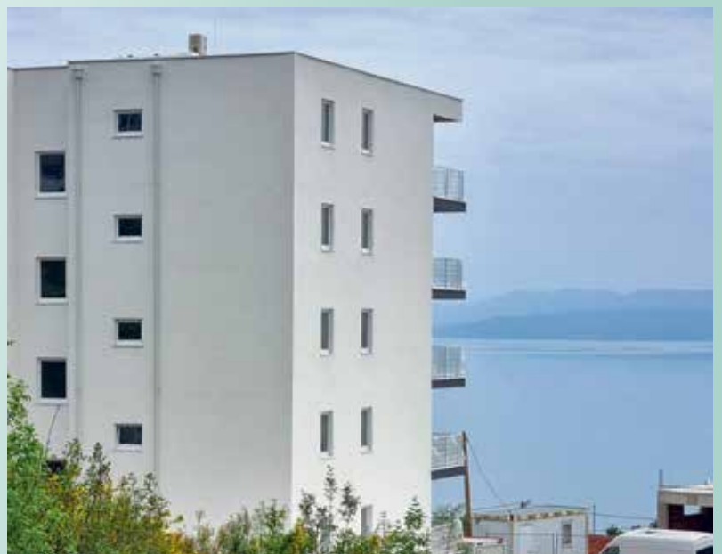
Pogled na Kvarner