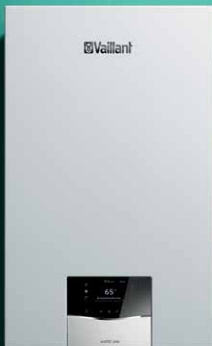
ecoTEC plus - nova generacija 2021.