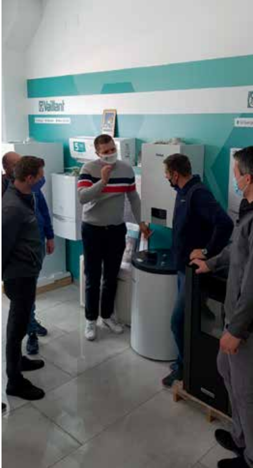
Dečki upijaju informacije kao spužve!