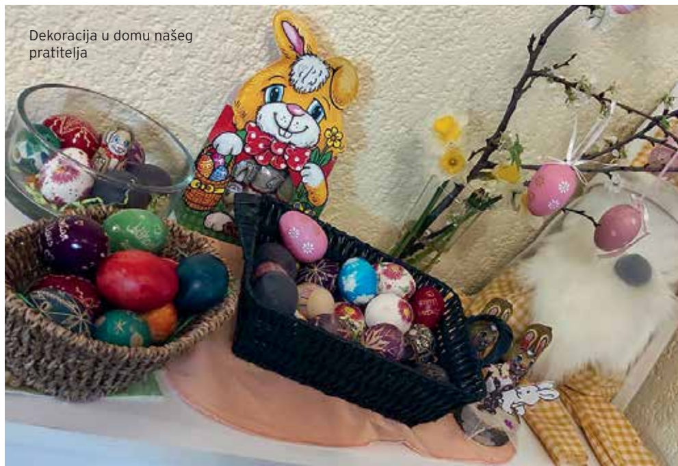
Dekoracija u domu našeg pratitelja