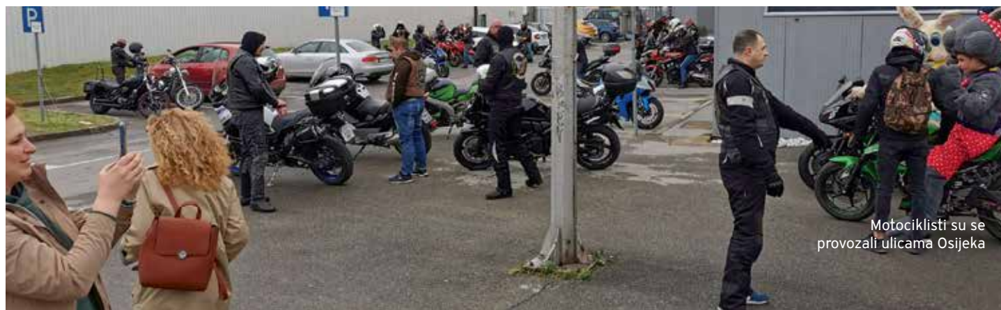
Motociklisti su se provozali ulicama Osijeka