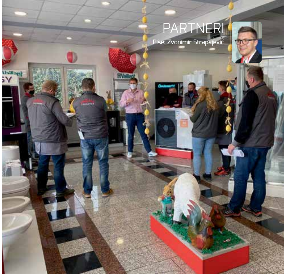
Uskršnje izdanje uz naš aroTHERM plus