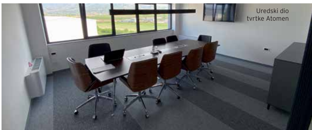
Uredski dio tvrtke Atomen