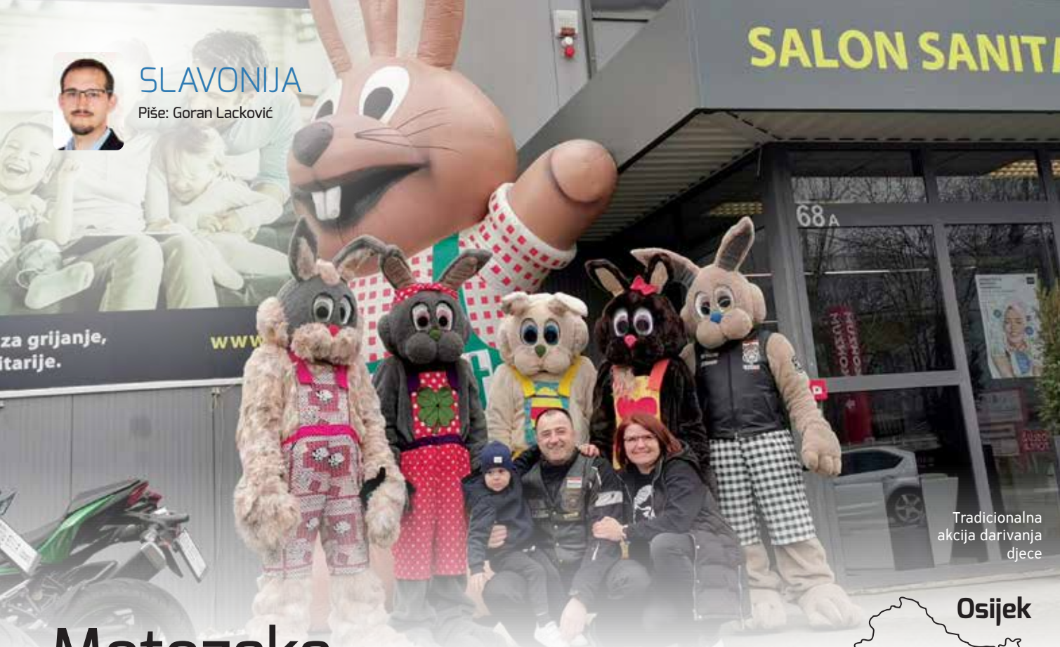
Tradicionalna akcija darivanja djece