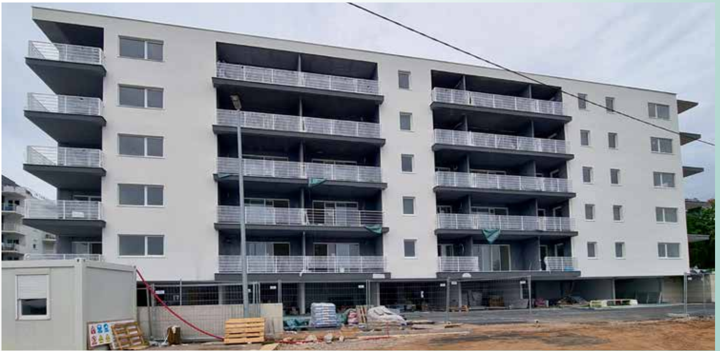
Višestambena zgrada, Srdoči

površinskog grijanja i instalacija ventilokonvektora za hlađenje a osnovni generator topline je Vaillantova dizalica topline aroTHERM u monoblock izvedbi. Arhitektonski je predviđena mogućnost da se vanjska jedinica dizalice topline može smjestiti u nišu izvedenu na gornjoj etaži objekta i time uklopiti u prostor bez da je vidljiva u okolišu ili pored objekta. Na jednaki način smještene su vanjske jedinice svih pet objekata. Termotehničke instalacije izveli su naši iskusni partneri, CIDTV instalateri A&M instalacije iz Novigrada.