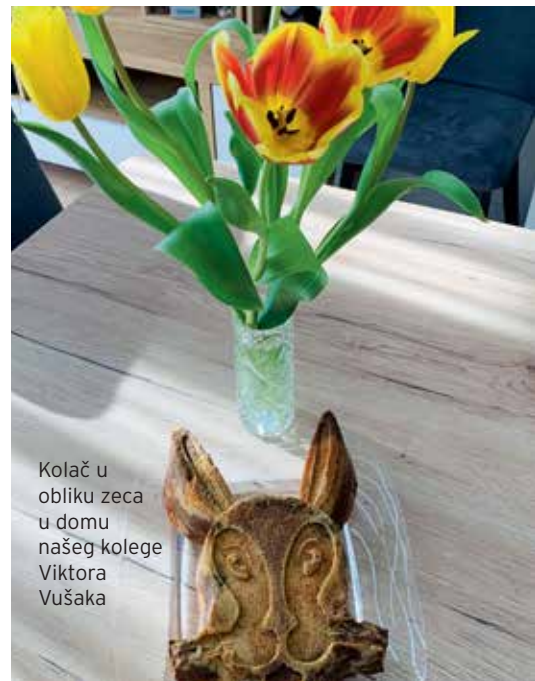
Kolač u obliku zeca u domu našeg kolege Viktora Vušaka