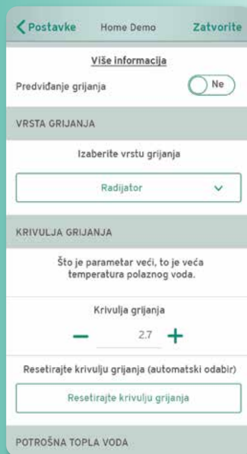
U aplikaciji se jasno vidi rad uređaja