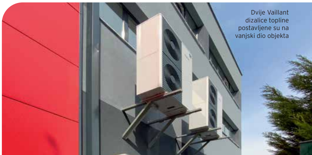
Dvije Vaillant dizalice topline postavljene su na vanjski dio objekta

Nastavljamo i dalje širiti krug zadovoljnih korisnika na tržištu Sjeverne Makedonije te se veselimo svim novim projektima. ■