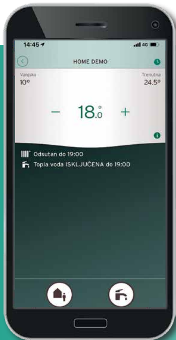
Početni ekran eRelaxa

Sredinom travnja Vaillant je započeo akciju prodaje sobnih termostata eRelax te VR 921 komunikacijskih jedinica sensoNET. Ciljevi akcije su: povezivanje usluge instalacije i prodaje proizvoda te poboljšanje kvalitete servisne usluge. Održane su edukacije u kojima su razmijenjena iskustva s našim serviserima te je nadopunjeno znanje o konfiguracijama regulacija eRelax i sensoNET VR 921. Jedan od velikih izazova je i edukacija korisnika o podešavanju i adekvatnom korištenju regulacije. Nužno je usvojiti znanja o osnovnim parametrima sustava kao što su: tjedni programi, specijalne funkcije, krivulja grijanja i slično.