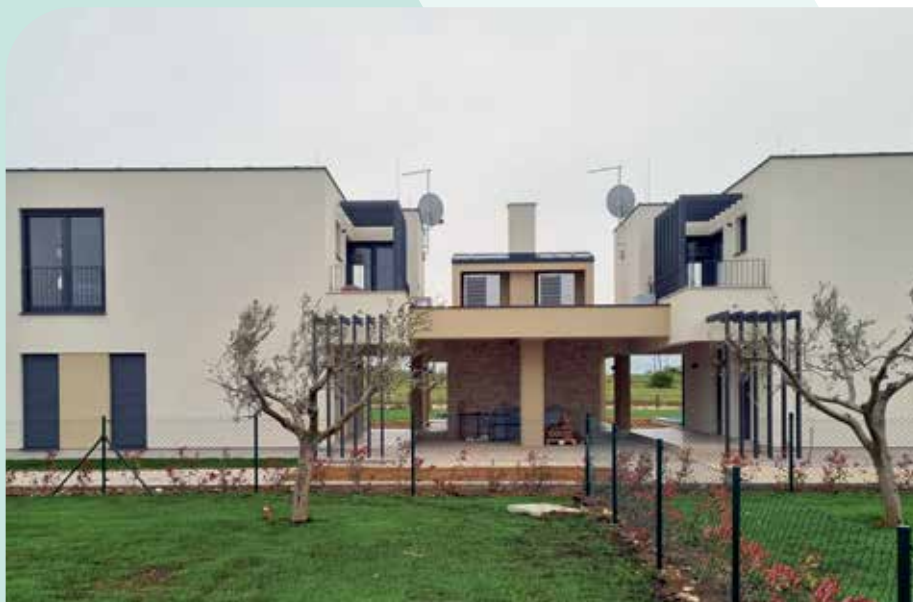
aroTHERM skoro pa nevidljiv