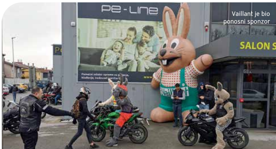
Vaillant je bio ponosni sponzor

S obzirom na izazove oko epidemije koronavirusa akcija Motozeke je ove godine prilagođena novonastaloj situaciji. Događanja su provedena uz pridržavanje svih propisanih epidemioloških mjera. Motociklisti su se u organiziranom defileu provozali ulicama grada Osijeka. Prva postaja bila je poslovnica Petrokov Osijek. Priređeni su darovi za djecu u udruzi Dar kao i za djecu u Sarvašu. Pozdravljamo ovu akciju u kojoj sudjelujemo svake godine te ostaje nada da će sljedeće Motozeke biti, kao nekad, moguće uživo s djecom na trgu Ante Starčevića u Osijeku. ■