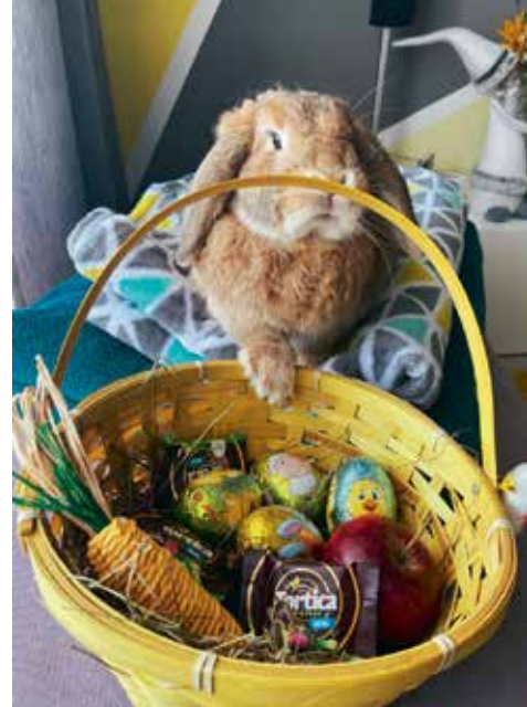
Zec pozira za dobru fotku!